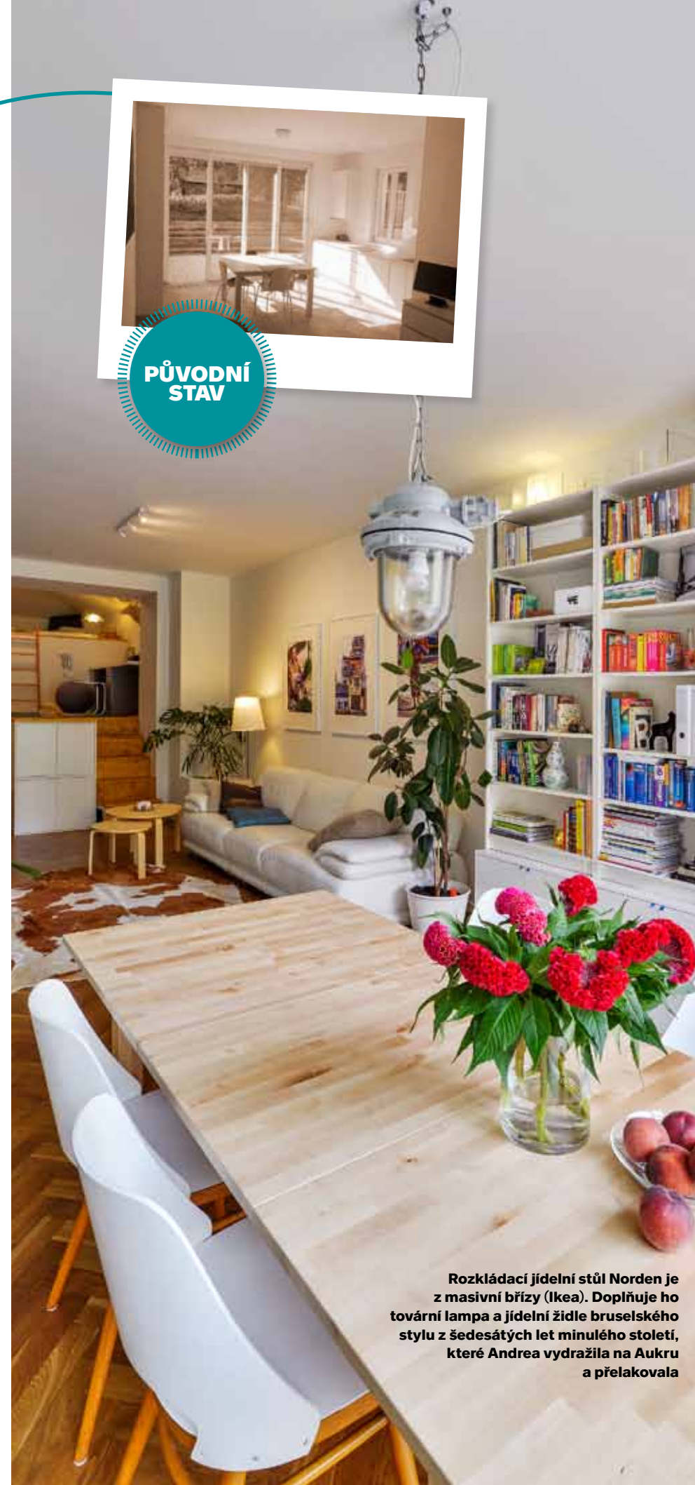
Rozkládací jídelní stůl Norden je z masivní břízy (Ikea). Doplnuje ho tovární lampa a jídelní židle bruselského stylu z šedesátých let minulého století, které Andrea vydražila na Aukru a přelakovala