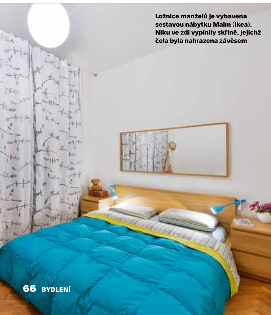
Ložnice manželů je vybavena sestavou nábytku Malm (Ikea). Niku ve zdi vyplnily skříně, jejichž čela byla nahrazena závěsem