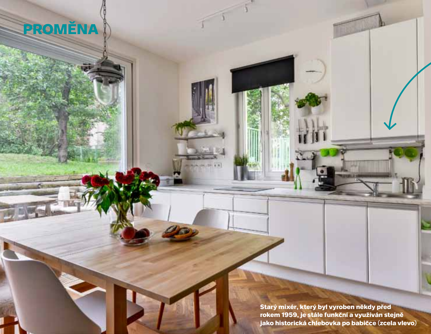
Starý mixér, který byl vyroben někdy před rokem 1959, je stále funkční a využíván stejně jako historická chlebovka po babičce (zcela vlevo)