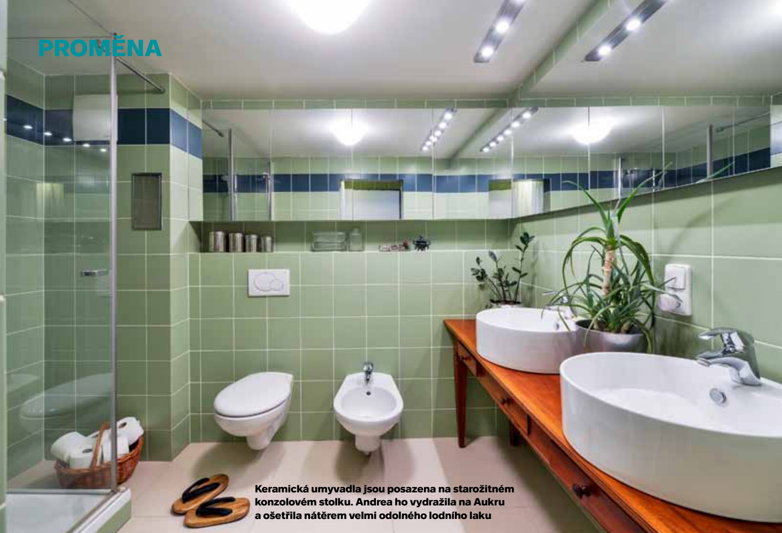
Keramická umyvadla jsou posazena na starožitném konzolovém stolku. Andrea ho vydražila na Aukru a ošetřila nátěrem velmi odolného lodního laku